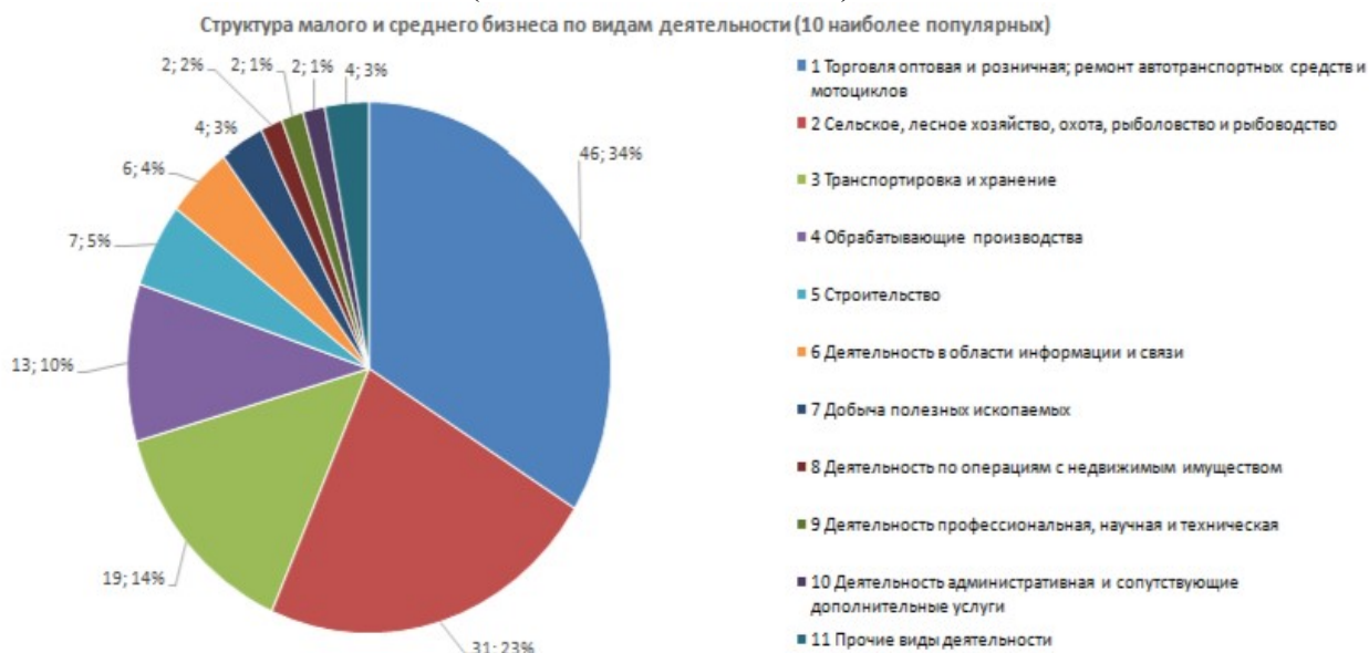
График 2. Структура малого и среднего предпринимательства в муниципальном образовании по видам деятельности (по состоянию на 10.12.2023)