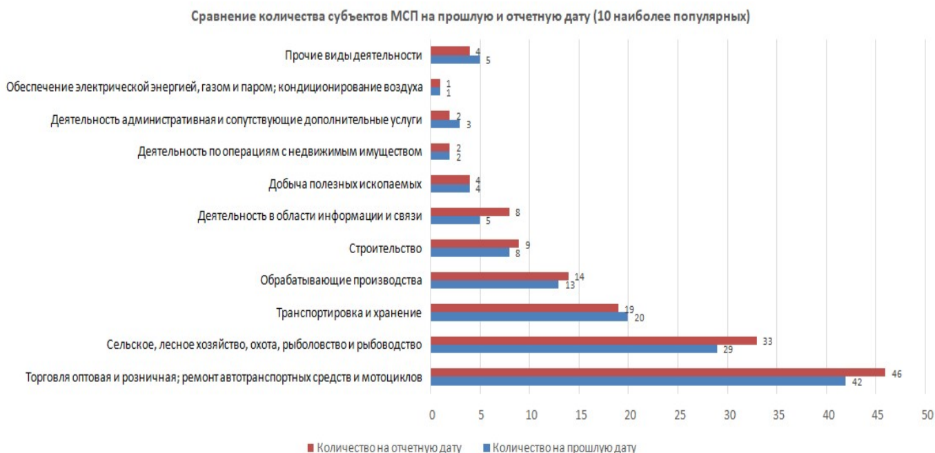
График 1. Динамика количества субъектов МСП в муниципальном образовании «Темкинский район» Смоленской области за период 10.05.2023-10.05.2024

За прошедший календарный год (с мая 2023 г. по май 2024 г.) число юридических лиц увеличилось на 2 ед. 2,08% и одновременно увеличилось число ИП на 8 ед. или 9,41%.