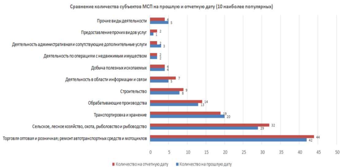
График 1. Динамика количества субъектов МСП в муниципальном образовании «Темкинский район» Смоленской области за период 10.03.2023-10.03.2024

Согласно графику, построенному по данным Единого реестра субъектов малого и среднего предпринимательства, динамика прироста количества ИП за календарный год (с марта 2023 по март 2024) была значимо положительной