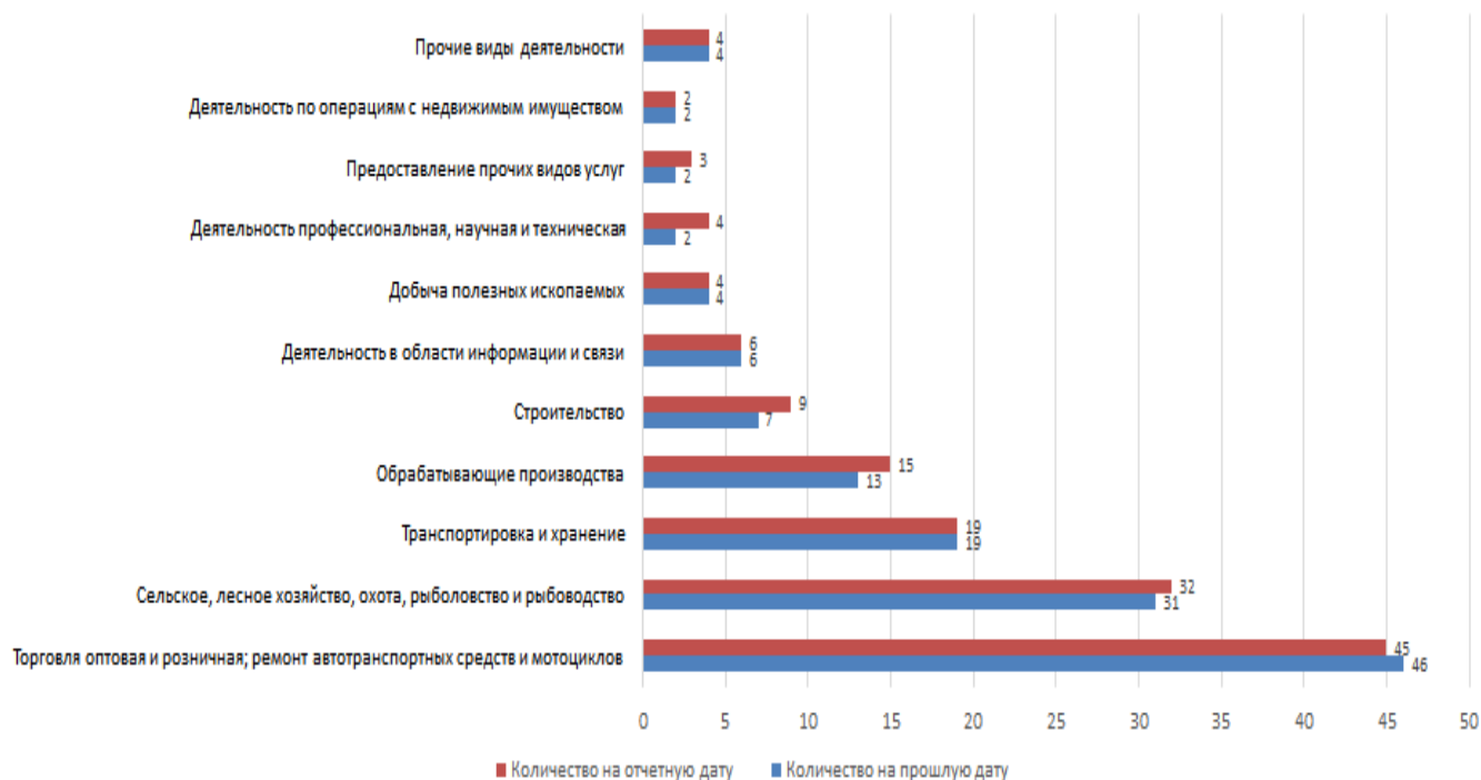
Сравнение количества субъектов МСП на прошлую и отчетную дату (10 наиболее популярных)

Согласно графику, построенному по данным Единого реестра субъектов малого и среднего предпринимательства, динамика прироста количества ИП и ЮЛ с 10 декабря 2023 по 10 декабря