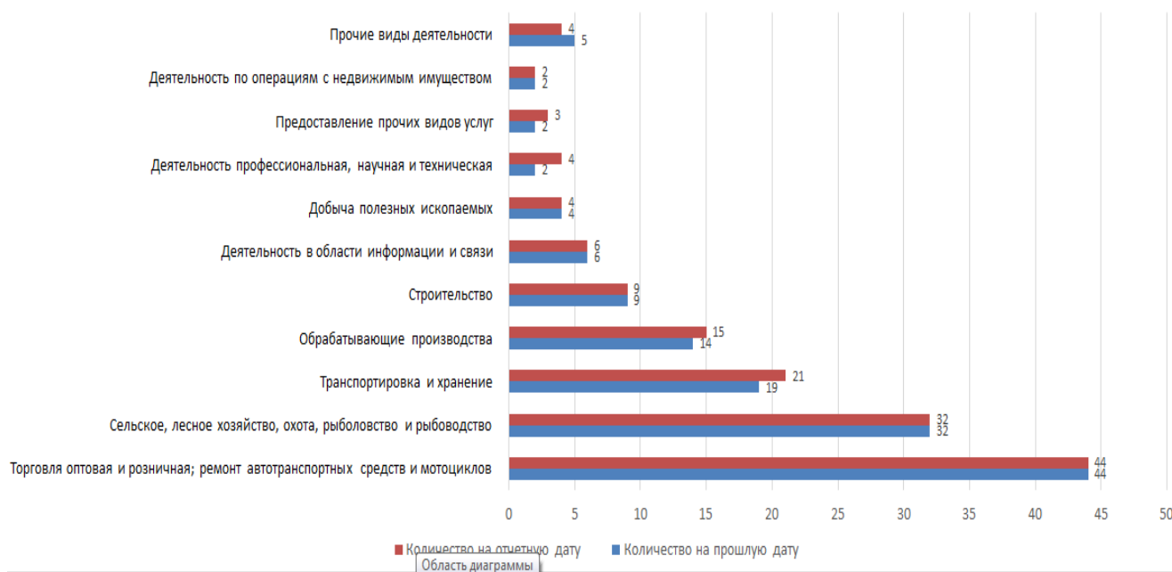
Сравнение количества субъектов МСП на прошлую и отчетную дату (10 наиболее популярных)

Согласно графику, построенному по данным Единого реестра субъектов малого и среднего предпринимательства, динамика прироста количества ИП и ЮЛ с 10 февраля 2024 по 10 февраля 2025 года незначительно изменялась то в сторону увеличения, то в сторону уменьшения. В силу специфики работы Единого реестра МСП в июле 2024 отмечено незначительное снижение, а в декабре 2024 увеличение численности ИП.