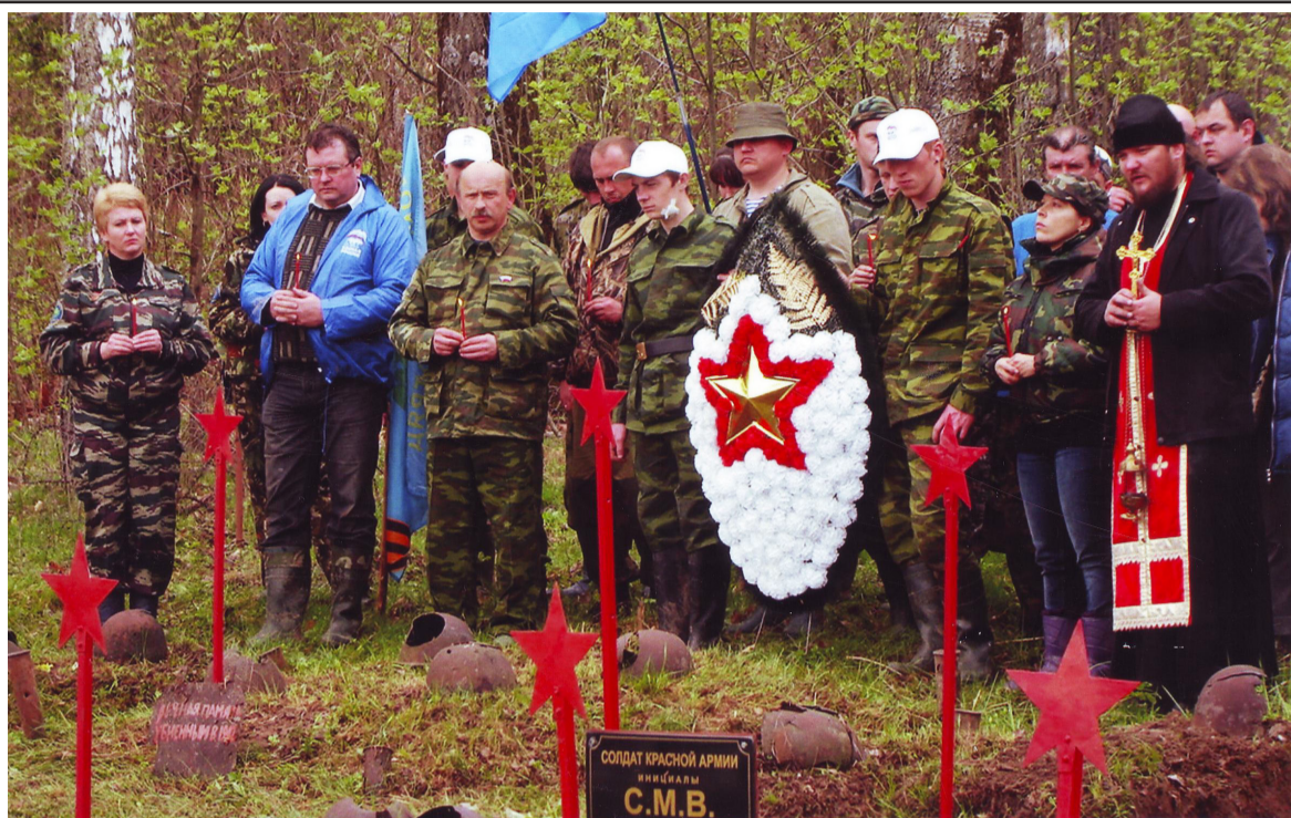
Момент митинга, проходившего 6 мая в урочище Березки Вязищенского сельского поселения.