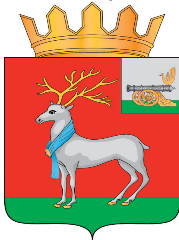
Рис. 3 «В червленом поле узкая зеленая оконечность, на которой стоит серебряный олень с золотыми рогами и копытами, на шее у оленя лазоревый шарф, скрепленный золотой пряжкой. В вольной части щита слева - герб Смоленской области. Щит увенчан короной для районов РФ».

Многоцветный рисунок герба МО «Темкинский район» Смоленской области (полный герб)