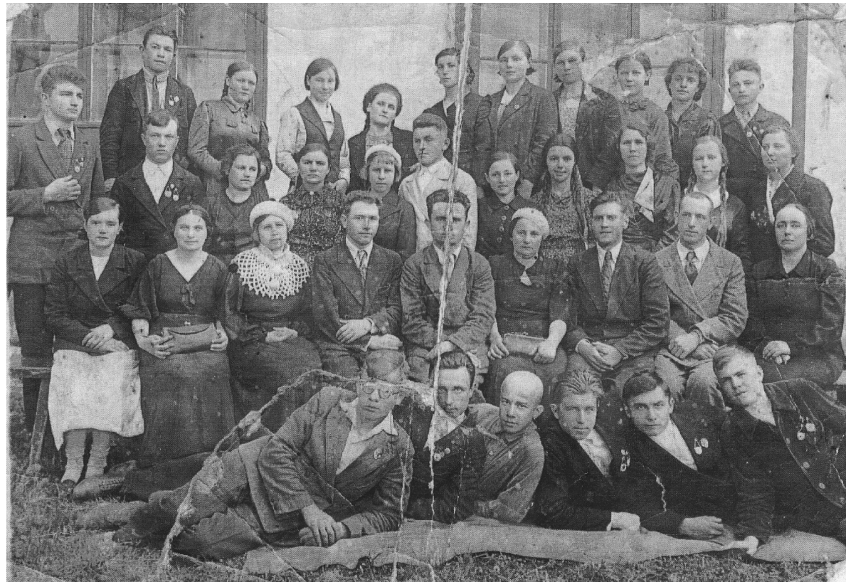
Учителя и выпускники Темкинской средней школы 1941 года.

вич - погиб в Сталинграде в 1942 году, парашютист 41 стрелковой дивизии 1-й Гвардейской армии (нижний ряд - второй слева).