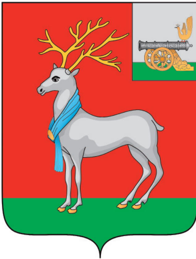
Рис. 2 «В червленом поле узкая зеленая оконечность, на которой стоит серебряный олень с золотыми рогами и копытами, на шее у оленя лазоревый шарф, скрепленный золотой пряжкой. В вольной части щита слева - герб Смоленской области».

Многоцветный рисунок герба МО «Темкинский район» Смоленской области (герб с вольной частью)