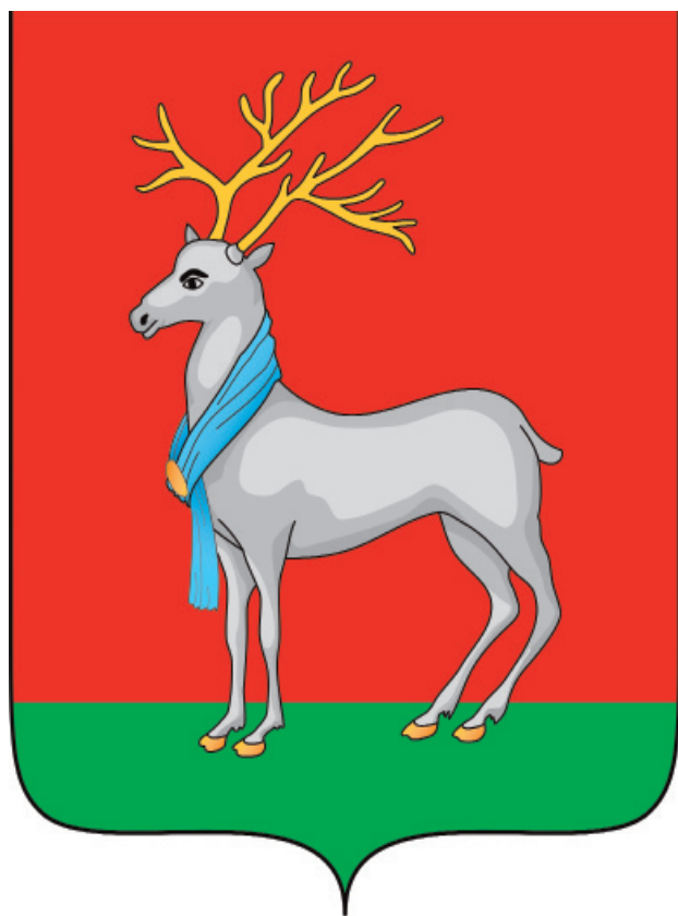
Рис.1 «В червленом поле узкая зеленая оконечность, на которой стоит серебряный олень с золотыми рогами и копытами, на шее у оленя лазоревый шарф, скрепленный золотой пряжкой».

Многоцветный рисунок герба МО «Темкинский район» Смоленской области (герб без вольной части)