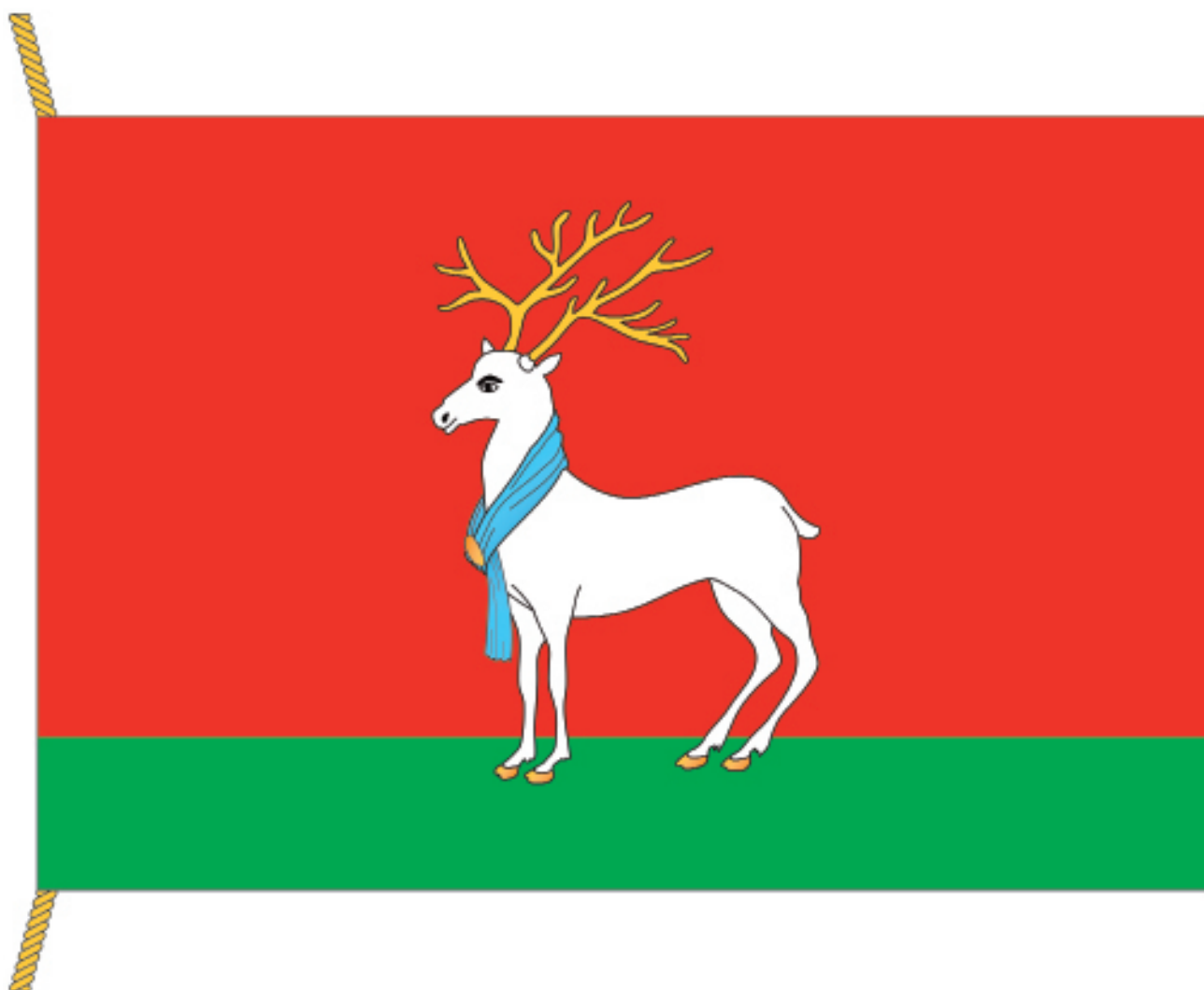
Рис. 4 «Прямоугольное красное полотнище с соотношением сторон 2:3 повторяет сюжет герба МО «Темкинский район» выполненный белой, зеленой, желтой и голубой красками».

Рис.1 - есть собственно герб Темкинского района.