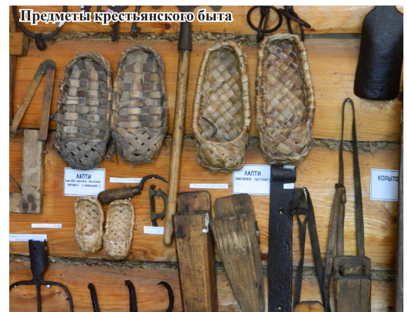
Предметы крестьянского быта