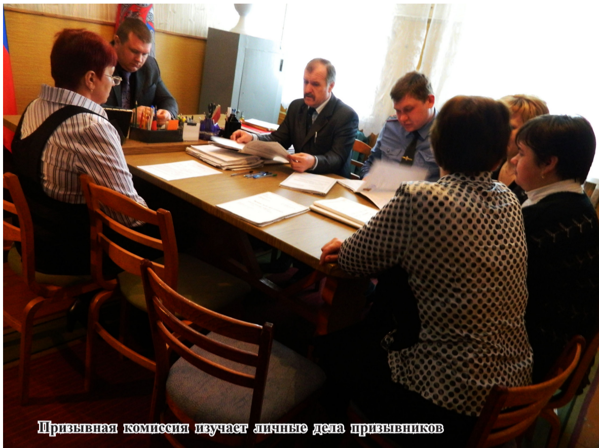
Призывная комиссия изучает личные дела призывников

Нынешняя призывная кампания, также как и предыдущая, пройдет под пристальным общественным контролем. Во всех военных округах продолжится эксперимент по сопровождению