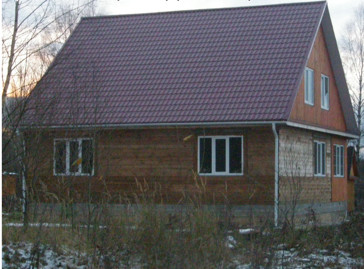
Дом для молодой семьи, построенный по Программе «Социальное развитие села до 2013 года»

очень удивлен, что в таком богатом историей районе до сих пор нет своей символики. Началась долгая и кропотливая работа. И вот в этом году наш район, наконец-то, получил свидетельство государственного образца о регистрации официальных символов, которые также были внесены в Государственный геральдический регистр Российской Федерации.