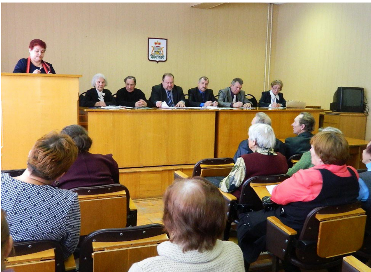
Сотрудничаем на местном уровне