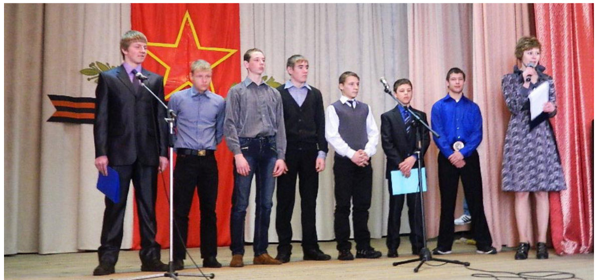
20 февраля в Темкинском Доме культуры состоялся районный конкурс «Богатыри земли темкинской». Материал читайте в следующем номере.

Цена подписки: а почте на 1 месяц - 32 руб.60 коп., на 3 месяца - 97 руб. 80 коп., в редакции на 1 месяц - 25 руб. 00 коп.