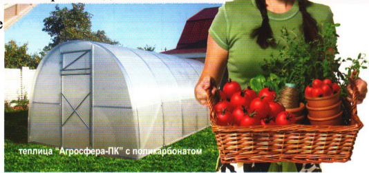
У кого наша теплица, будет всё всегда родиться!

Звоните: 8-903-698-26-45 8-915-633-72-78 с. Темкино ул. Ефремова, д.6