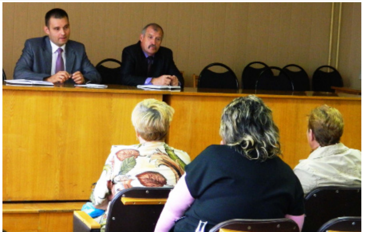
В Администрации района

Пресс-служба Администрации Смоленской области