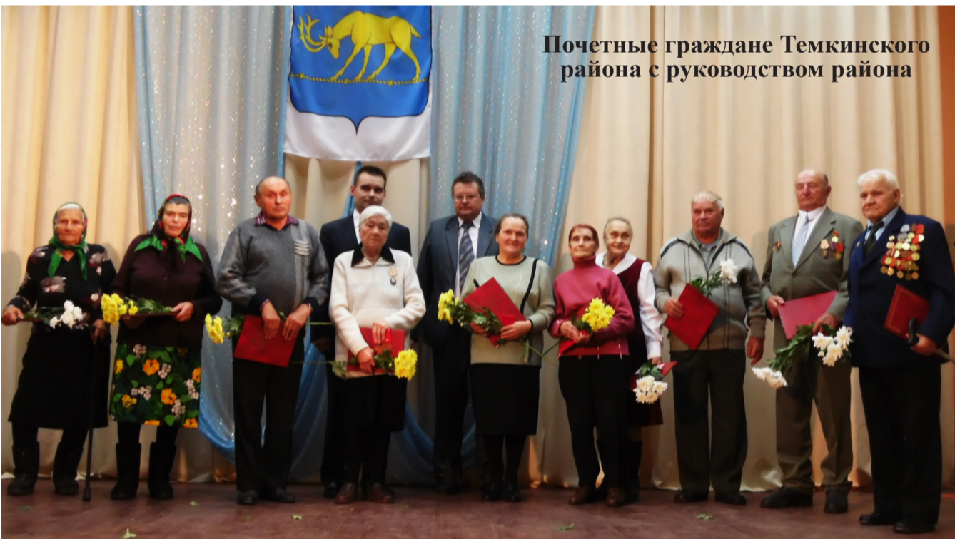
Почетные граждане Тёмкинского района с руководством района

ской области А.В.Островский, приглашённый затем на сцену, свою поздравительную речь начал совсем не помпезно: - Уважаемые тёмкинцы! Понимаю, что жизнь в районе тяжела и сложна, но я благодарен главам и всем руководителям за то, что они работают и пытаются ситуацию исправить. Судя по вашему видеоролику, многое сделано. Мы пытаемся по-