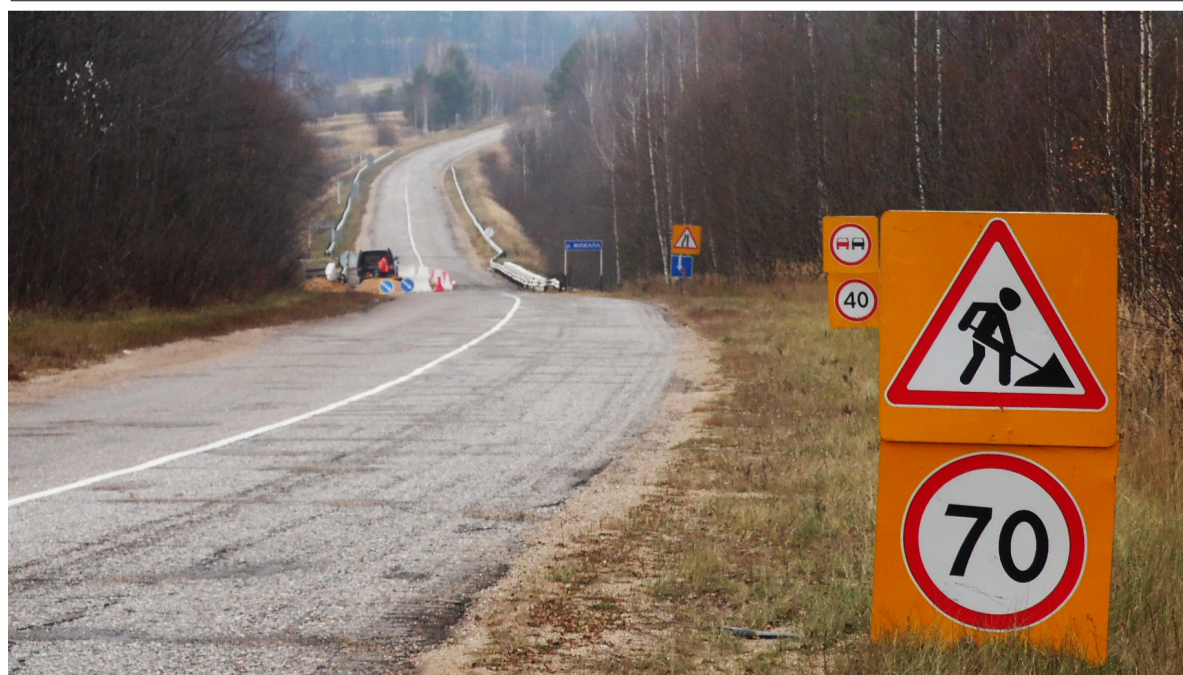
Материал о ремонте моста читайте на странице 2.