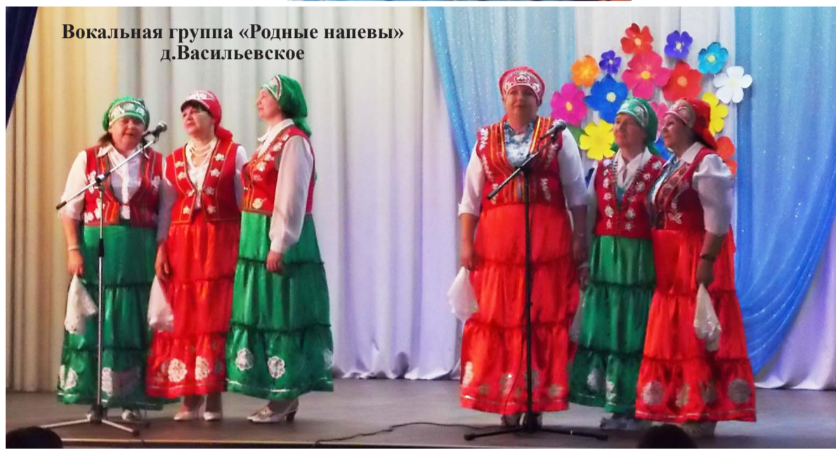
Вокальная группа «Родные напевы» д.Васильевское