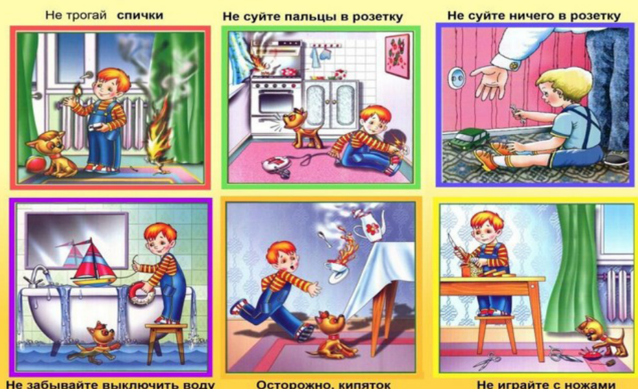
Не забывайте выключить воду