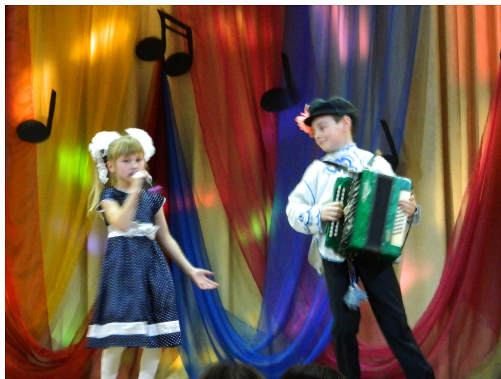
Участники праздника все были одаренные, иначе бы они не попали на эту