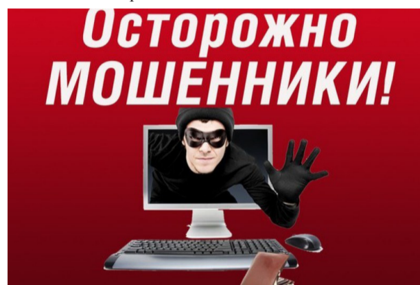
Схема обмана такова: «лжепокупатель» звонит по объявлению и сразу заявляет, что предлагаемый товар ему очень подходит, он хочет забрать его этим же вечером, а чтобы не упустить такой привлекательный вариант, готов внести аванс прямо сейчас на карту продавца. При этом он убеждает собеседника, что для подтвержде-

ным методам мошенников - это рассылка вирусных программ, СМС-сообщений о якобы заблокированных картах - добавился еще один. Деньги с карт воруют у пользователей сайтов бесплатных объявлений о продаже товаров и услуг.