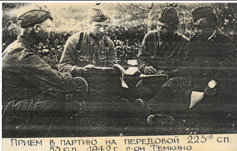
ПРИЁМ В ПАРТИЮ НА ПЕРЕДОВОЙ 223-й СП. 53 СД, 1942 г., Р-ОН ТЕМКИНО.

В районном историко-краеведческом музее хранится немало документов и экспонатов - свидетелей истории борьбы за освобождение района от немецко-фашистских захватчиков,- истории Великой Отечественной посвящен целый раздел музея.Здесь есть и уникальные экспонаты.