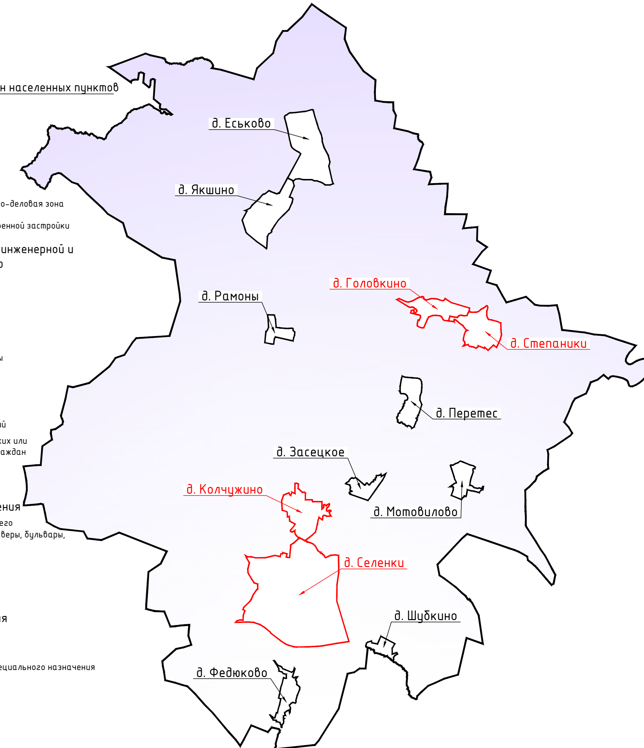
Схема расположения населенных пунктов на территории Павловского сельского поселения (ранее Селенское) Темкинского района Смоленской области